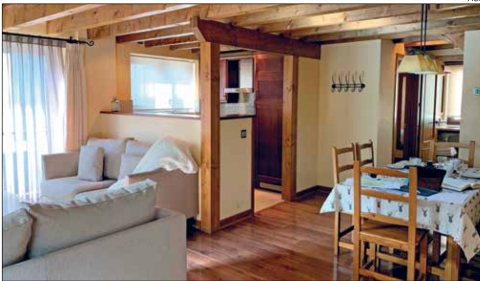
L'entitat turística ha demanat la impugnació de setze articles de la normativa de Roda de Berà.

Pel que fa a l'ordenança rodencina, l'ATT ha demanat la impugnació de setze articles que recullen aspectes que consideren que «s'aparten de la realitat mercantil i jurídica» d'aquests habitatges, com la vigilància dels clients, haver de personar-se en terminis molt breus o posar rètols informatius, tres mesures que també es troben recollides en el primer esborrany de l'ordenança salouenca. Com a exemple, l'Associació d'Apartaments Turístics de Tarragona recorre l'article 12 de la normativa rodencina en què s'estipula que «els titulars o les persones físiques o